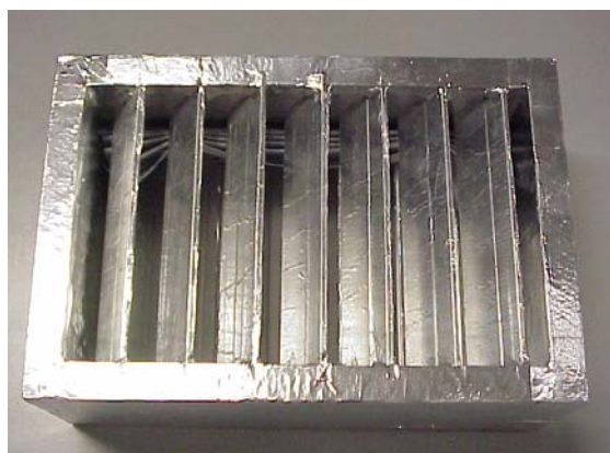
FIRE DAMPER REI 180