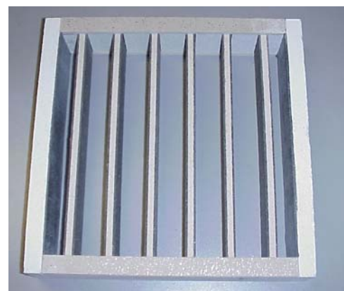
FIRE DAMPER REI 120